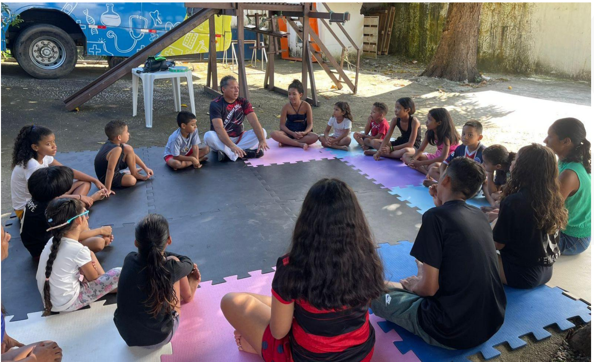
- Crianças e adolescentes: Capoeira com mestre dourado.