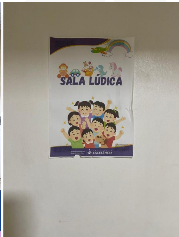
- Sala Lúdica.