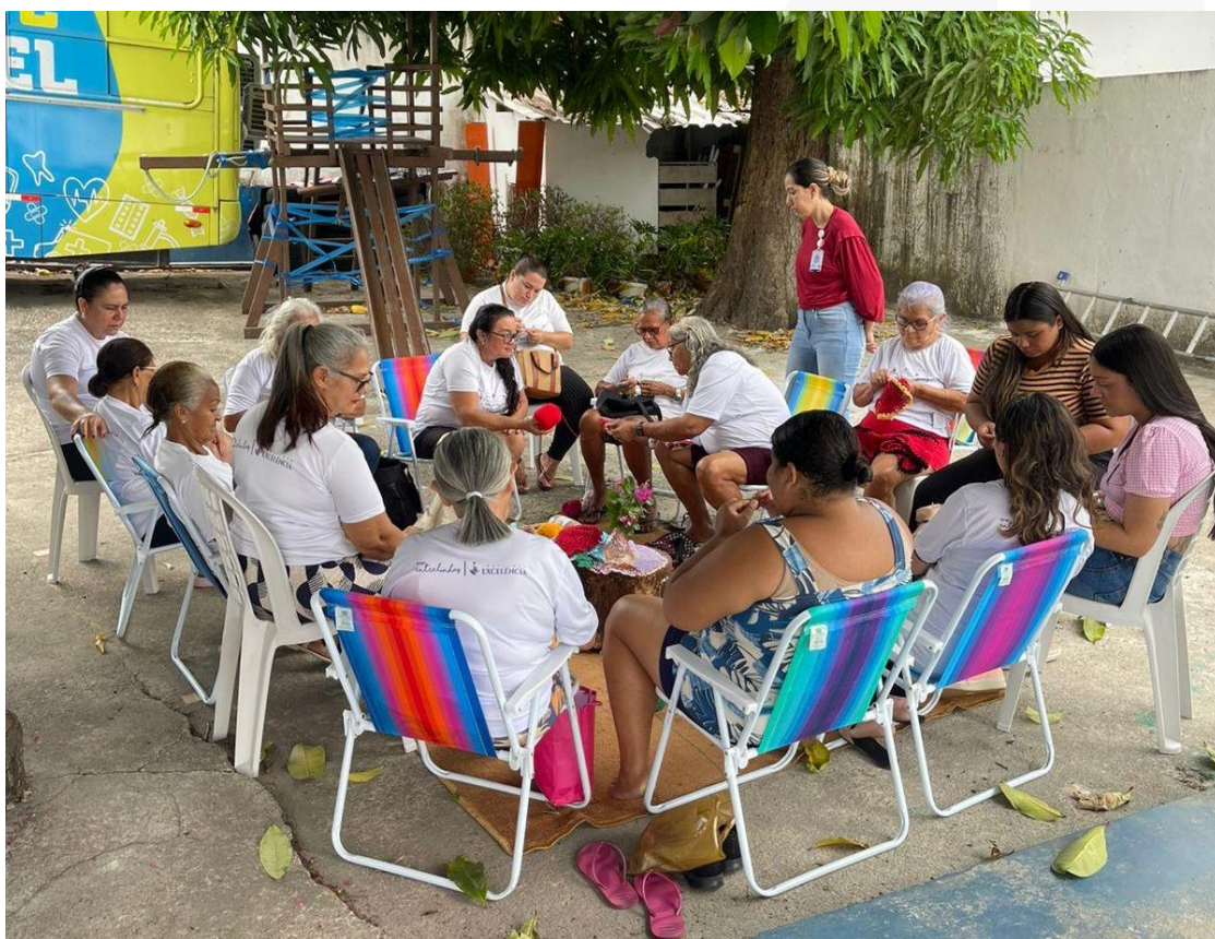
- Grupo Entrelinhas.