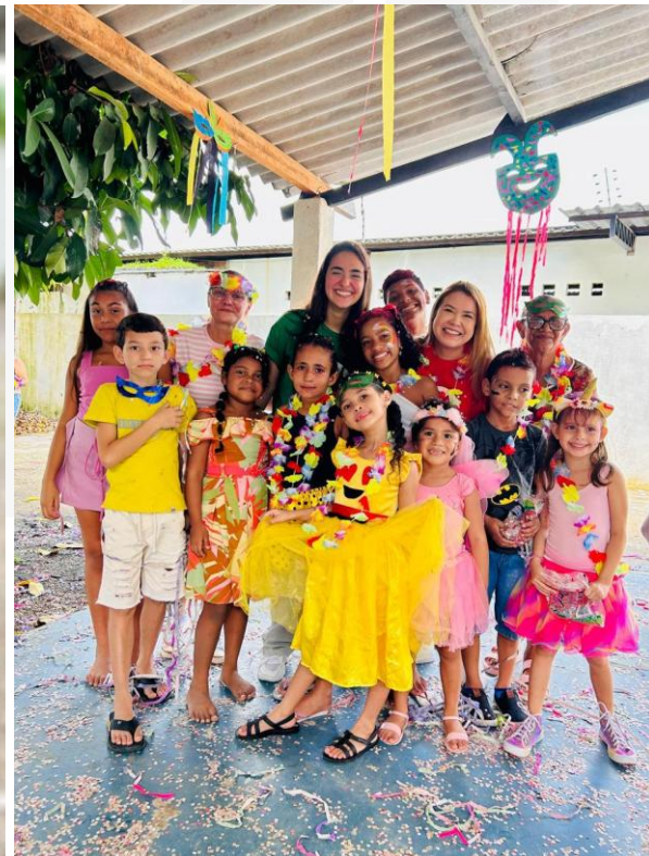
- Crianças e adolescentes: Bloquinho do IE Social.