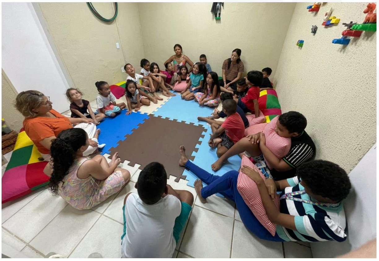
- Face Kids.