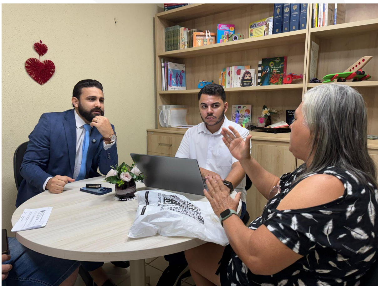
- Grupo Memórias: BM firma de advogados.