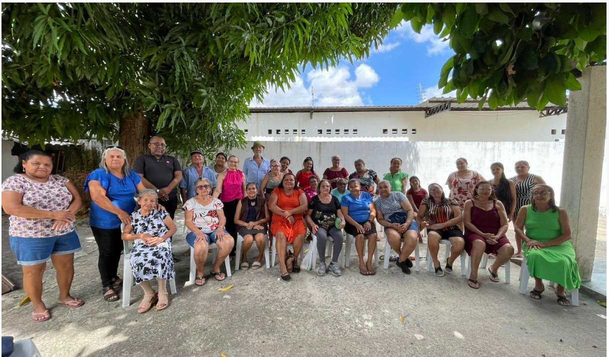
- Grupo Memórias: Projeto paz no lar.