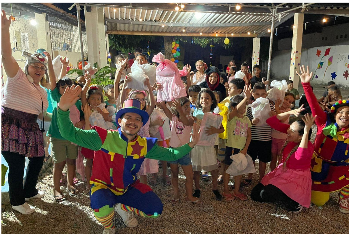
- Festinha das crianças