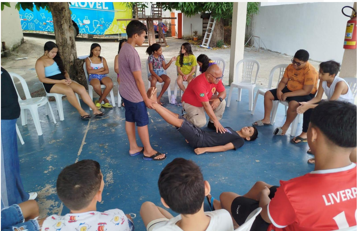
Adolescentes: Atlético Raps