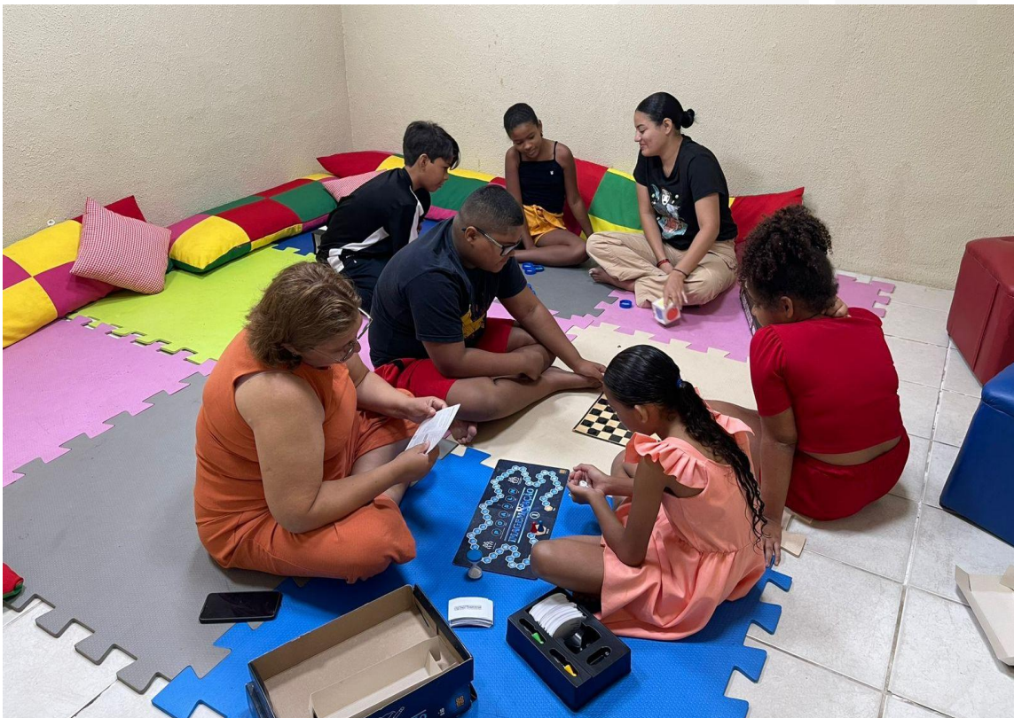
- Grupo Face