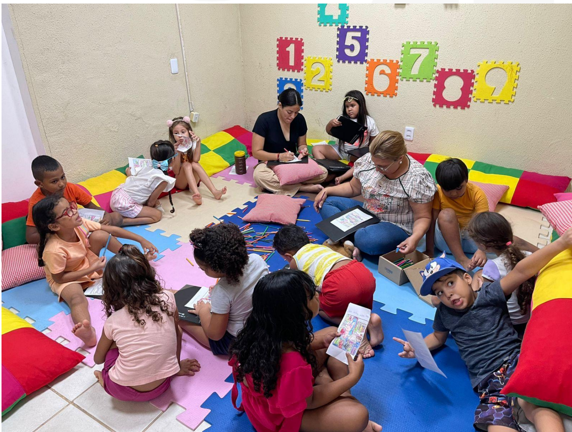
- Grupo Divertidamente.