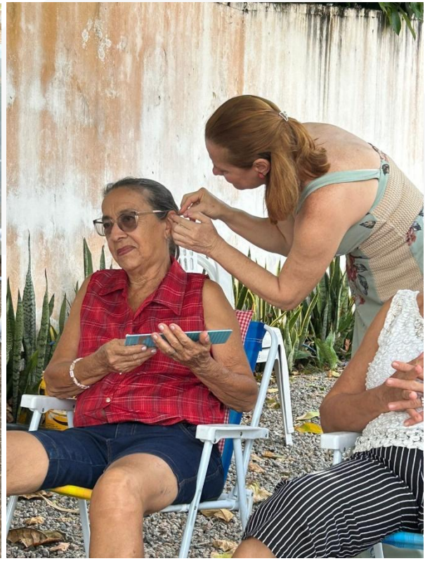
- Momento de cuidado