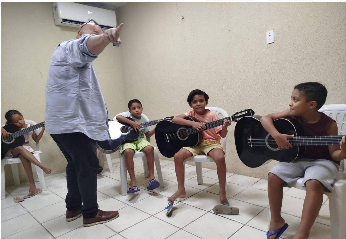
- Aula de violão.