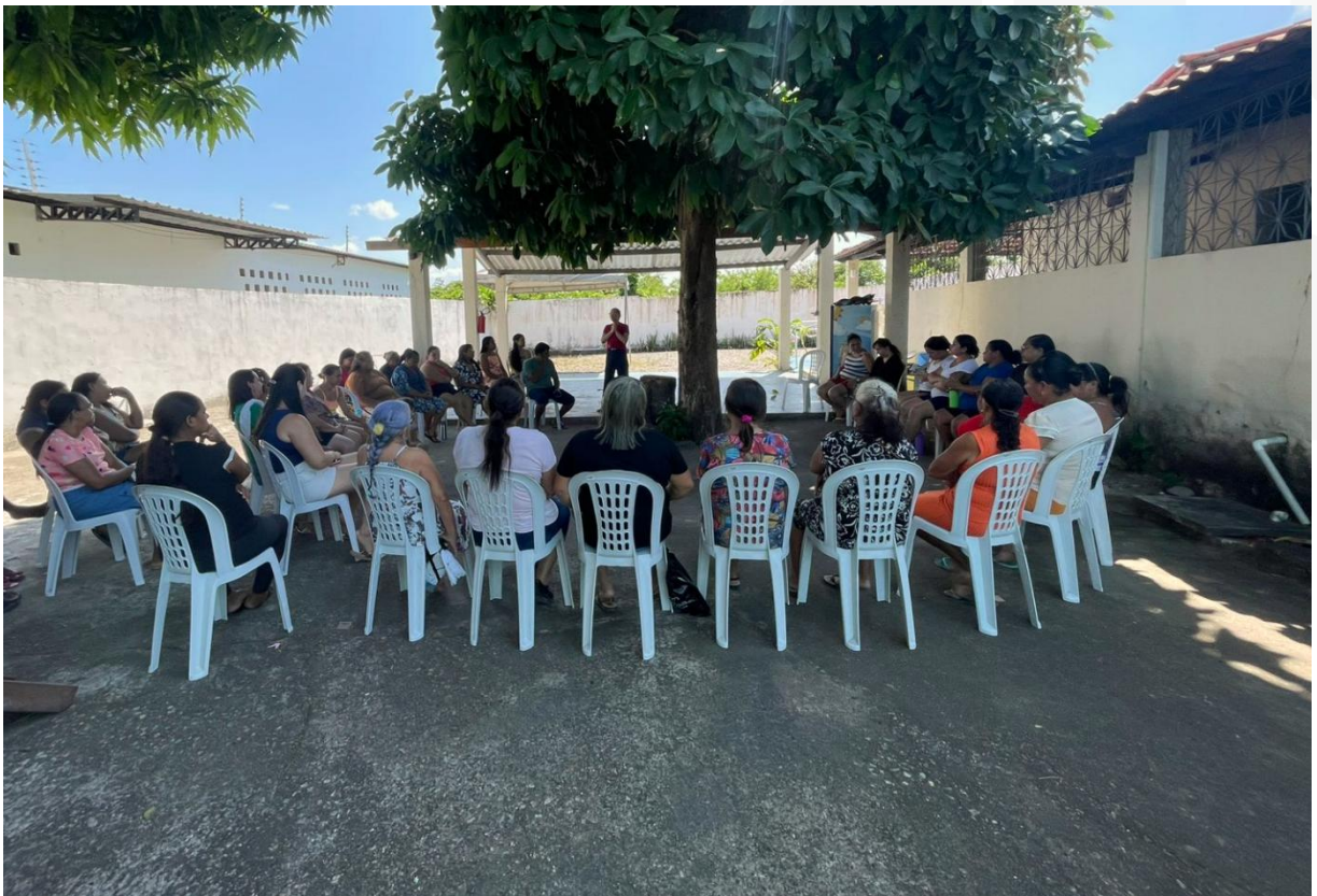
- Reunião com as famílias.