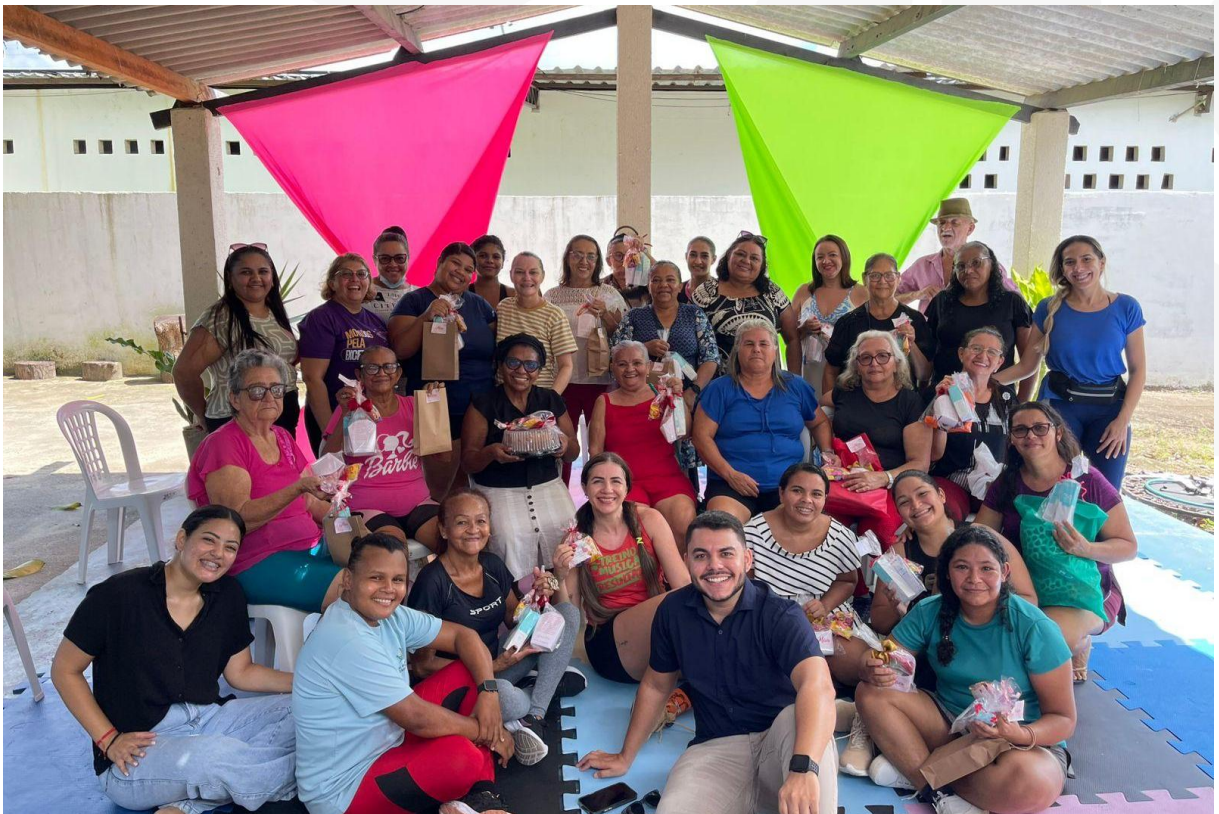
- Dia das mães.