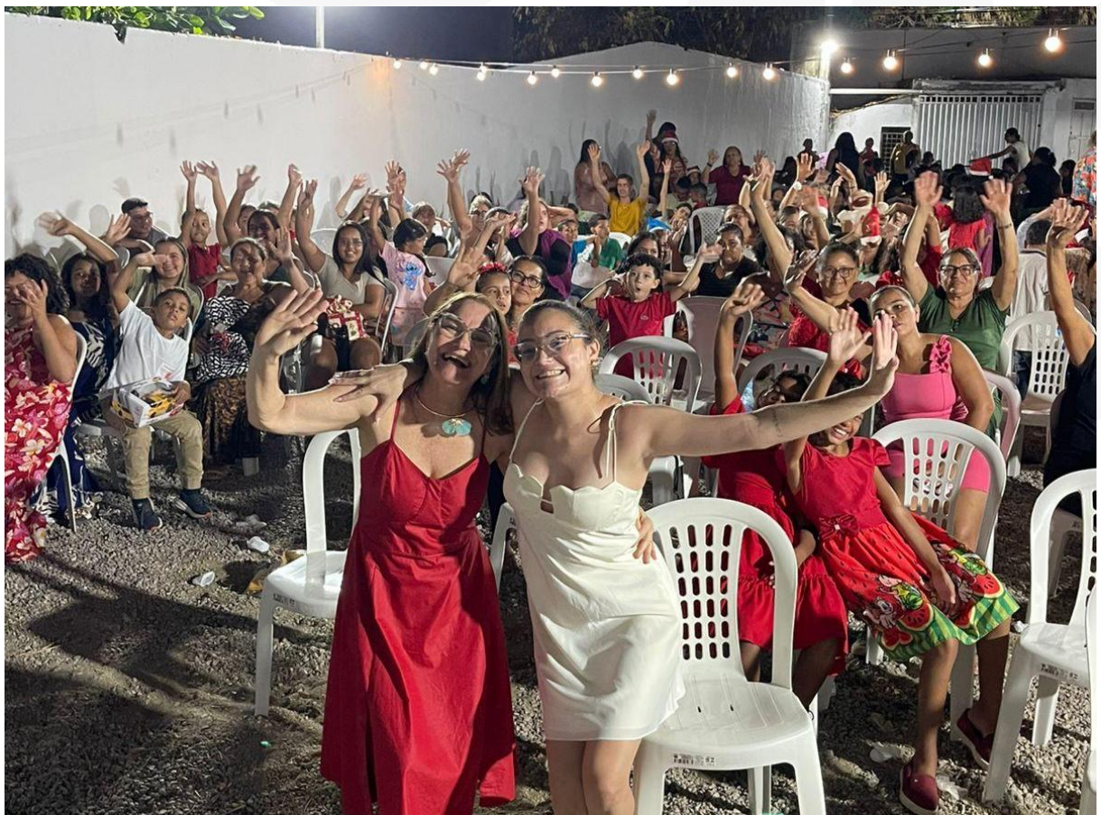
- Natal 3ª edição.