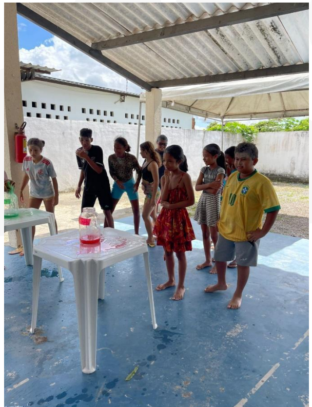
- Crianças e adolescentes: Colônia de férias.