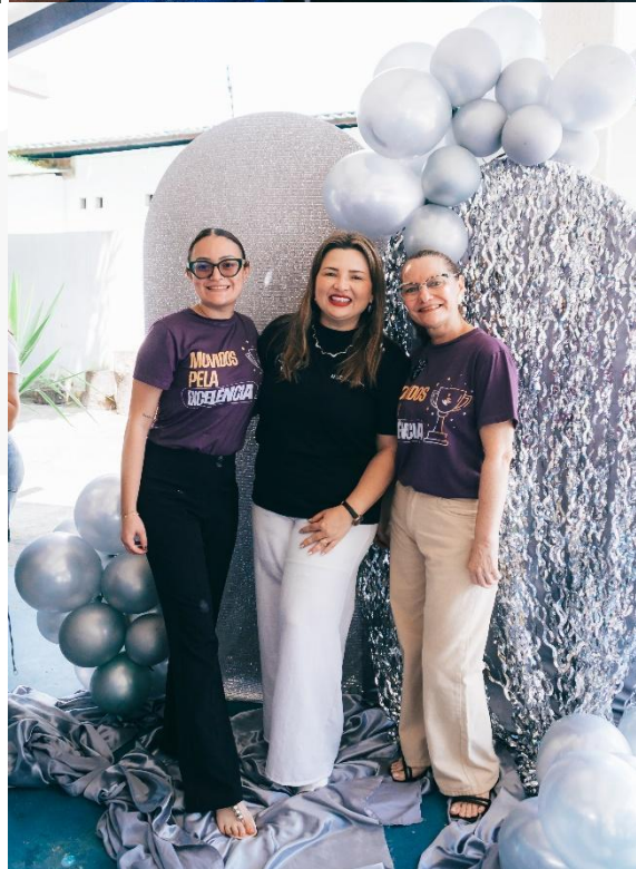
- Ação elas por elas: Igreja Cc videira Maracanaú.